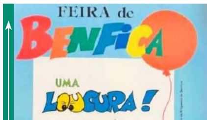
Regresso da Feira de Benfica em 2026