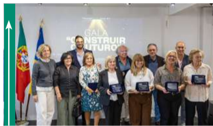
3ª edição da Gala “Construir o Futuro”