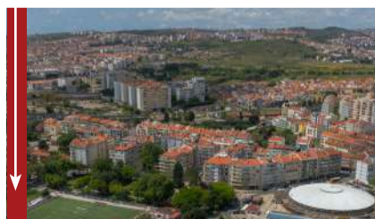
Falta de criação de lugares de estacionamento por parte da CML