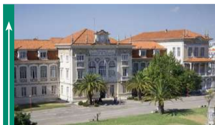
40.º aniversário do Instituto Politécnico de Lisboa