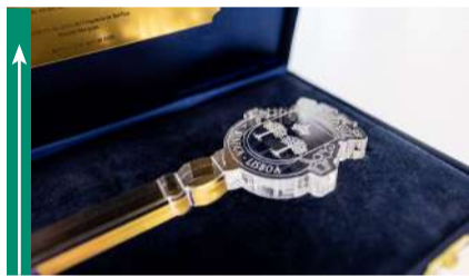
Entrega da Chave de Honra à família de António Lobo Antunes