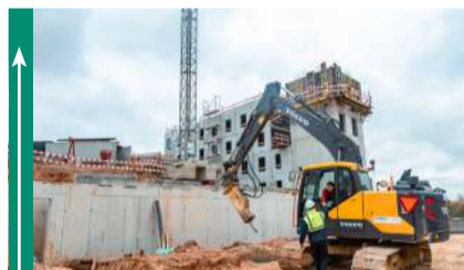
Avança a bom ritmo construção de 50 apartamentos no Calhariz de Benfica