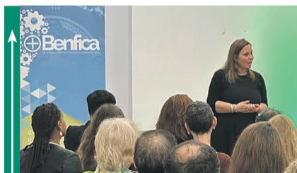
Associação + Benfica celebra uma década ao serviço do desenvolvimento local