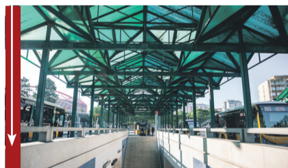
Terminal do Colégio Militar votado ao abandono por parte da CML