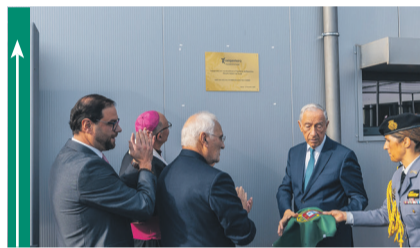
Inauguração das novas Instalações da IPSS "O Companheiro"