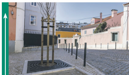
Reabertura ao Trânsito da Zona Histórica de Benfica