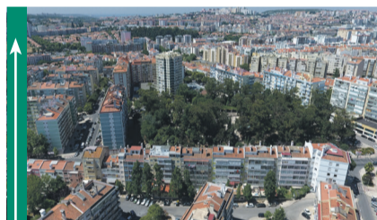
Benfica considerada a melhor freguesia de Lisboa para viver